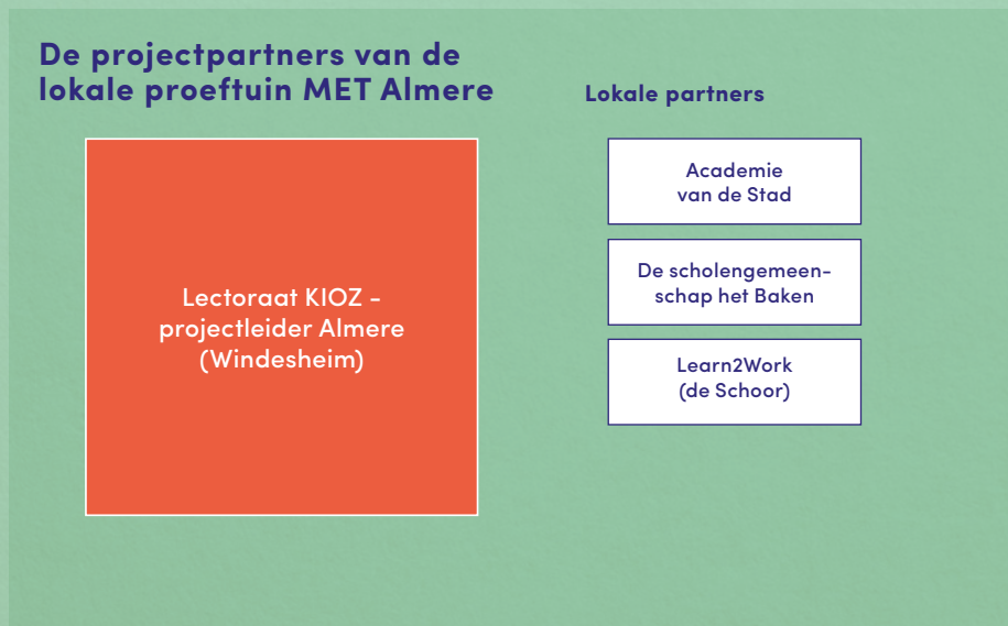
Tabel 1. Rolbeschrijving en expertise van de partners van het consortium van de landelijke proeftuin MET