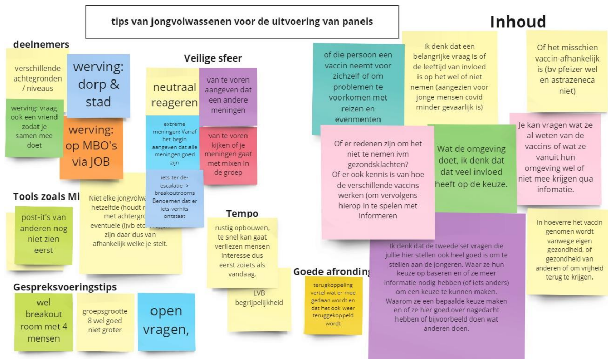
Afbeelding: een screenshot van een online MIRO bord met daarop tips en adviezen aan de onderzoekers voor de uitvoering van de panelgesprekken

In het eerste onderdeel zijn de onderzoeksvragen samen met vijf jongvolwassenen geoperationaliseerd. Door met hen in te gaan op opbouw, inhoud van de vragen en het creëren van een veilige sfeer is input opgehaald voor het opstellen van een gespreksleidraad voor de panelgesprekken. De deelnemers hebben aangegeven dat er ruimte moet zijn voor ieders mening (en dat dit door de gespreksleiders benadrukt moet worden, maar ook actief gehandhaafd), dat het soms prettig kan zijn om in een break-out room of in een kleiner groepje door te praten en dat de vragen vooral heel open gesteld dienen te worden. Het creëren van een veilige omgeving waarin men open en gelijkwaardig kan praten over ieders overwegingen om wel of niet te vaccineren is het belangrijkste.